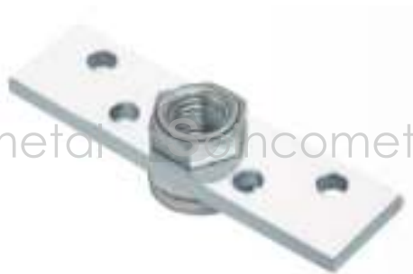
Refª 783 (M12, M18, M20)